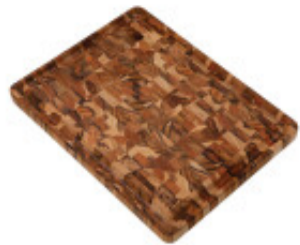
Tabla madera invertida para cortar "ROST" - TB1571